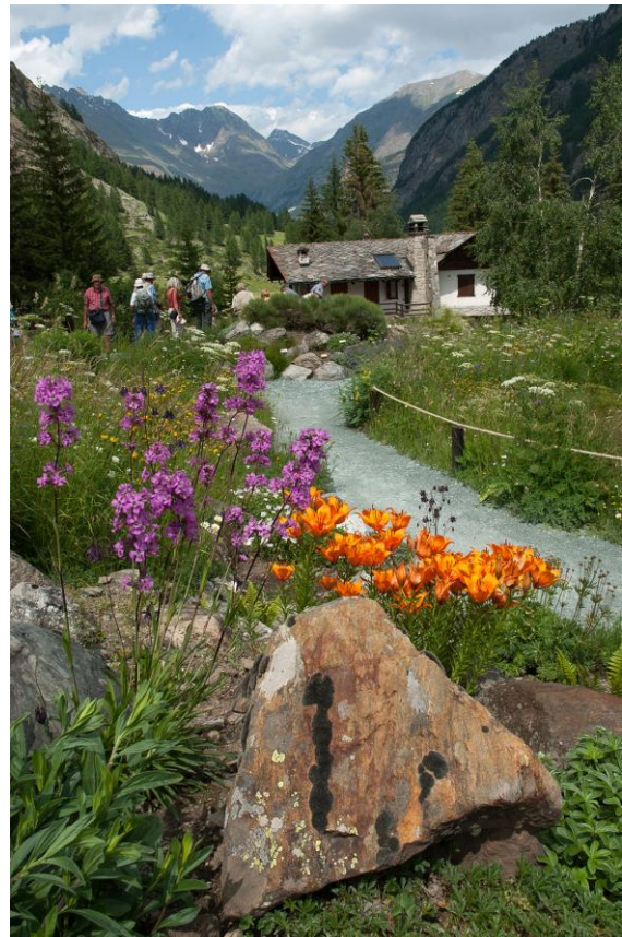
Il Giardino Botanico Alpino "Paradis"