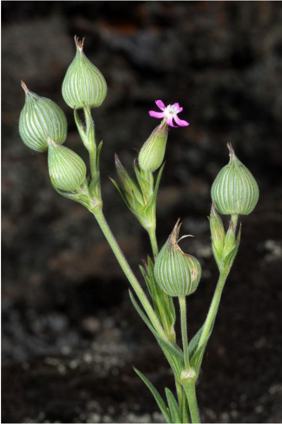
Silene conica a Pondel