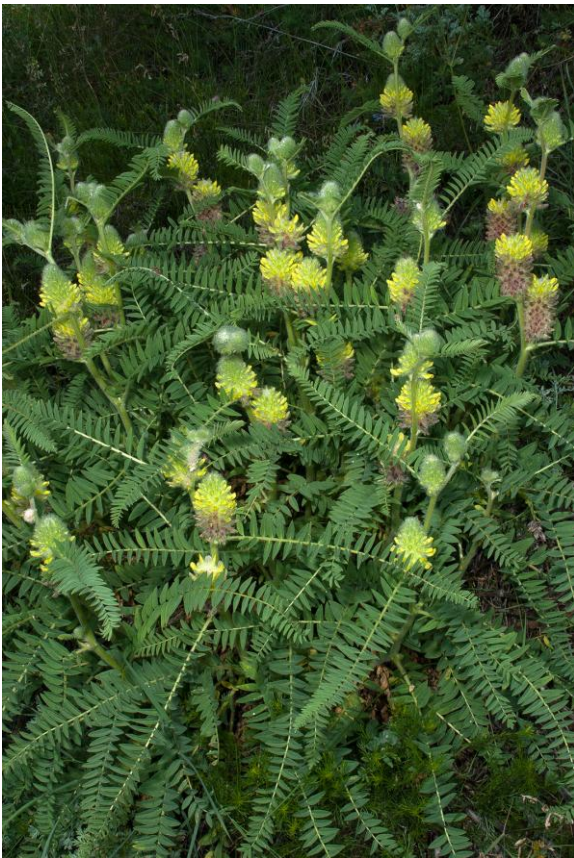
Astragalus alopecurus presso Epinel