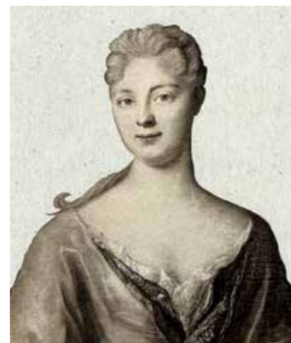
Madame de Warens (1699-1762)