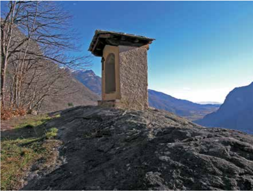
Sacralizzazione del territorio in tempi di Controriforma

chiave per la politica di contenimento del movimento riformatore: la missione era quella di sbarrare l'espansione verso sud. La politica delle grandi potenze cattoliche verso il Ducato, poi Regno di Sardegna, da metà Cinquecento a oltre metà Settecento può dunque interpretarsi almeno in parte come delega a regolare il problema della Riforma in Europa centro-meridionale, delega che contribuiva a legittimare l'esistenza dello Stato sabauda stesso. Il confronto ideologico era vivissimo: mi permetto di pensare che le famose "radici cristiane" che varie forze politiche insistentemente propongono oggi per fondare la Costituzione europea, sono quelle che nascono e si sviluppano in questo secolare conflitto, molto più che quelle delle origini giudaico-romane o del periodo medievale, ormai dimenticate.