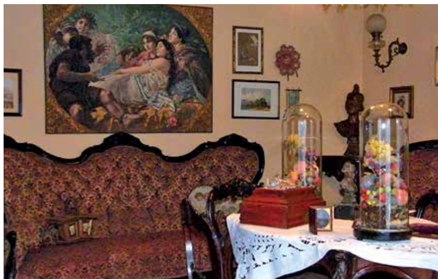
Il celebre Salotto di Nonna Speranza al Meleto di Guido Gozzano

Abbiamo approfittato della sapiente guida di Chantal Vuillermoz, autrice di un saggio su Gozzano in Val d'Ayas, per visitare la villa estiva del Poeta. Da notare, fra l'altro, nella villa la ricca biblioteca quasi per metà scientifica, le collezioni di farfalle, le foto di famiglia, il mobilio e l'arredamento originali o comunque d'epoca. Un piacevole giro del giardino, con il famoso frutteto, ha concluso la giornata.