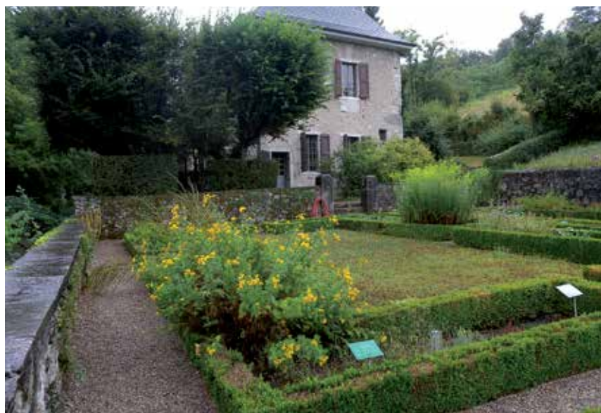
Les Charmettes a Chambéry - residenza giovanile di Jean-Jacques Rousseau