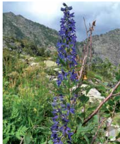
Delphinium elatum , sotto il rifugio

La ricchezza delle acque che scendono lungo i canali favorisce l'ampio sviluppo dell'intricato arbusteto igrofilo e nitrofilo di Ontano verde ( Alnus viridis ) nel quale compaiono numerose specie erbacee spesso di grandi dimensioni (da cui il nome di "megaforbie") dalle eguali esigenze edafiche. Tra queste si sono viste piante di rara bellezza come l'Aconito strozzalupo ( Aconitum vulparia ) dai fiori gialli, l'Aconito del Vallese ( Aconitum variegatum subsp. valesiacum ) dai fiori blu-violetti, il Pigamo con foglie di aquilegia ( Thalictrum aquilegifolium ), l'Hugueninia ( Hugueninia tanacetifolia ), il Doronico austriaco ( Doronicum austriacum ), la Rodiola ( Rhodiola rosea ). Sulle rupi spicca la