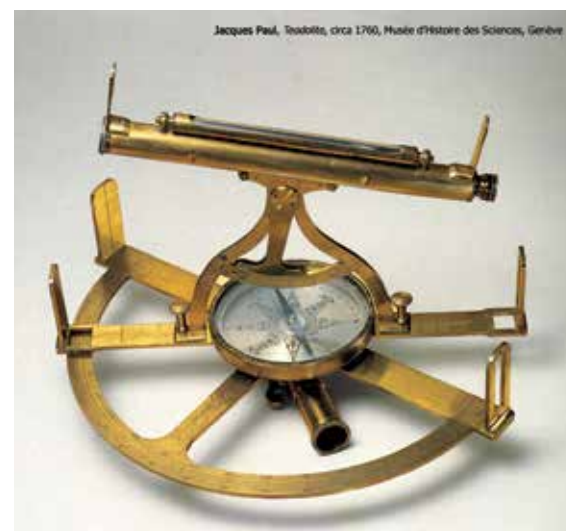
Jacques Paul, Teodolite, circa 1760, Musée d'Histoire des Sciences, Genève

Un'altra costante strategica del Ducato, poi Regno di Sardegna, è la gestione del confronto politico e