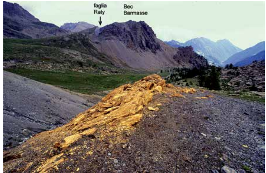
Una delle maggiori attrattive geologiche del Parco: la Faglia Raty. Primo piano delle schiume carbonatiche ( listveniti ) e proseguimento della faglia sul Bec Barmasse.

E' stato avviato il nuovo progetto biennale "E-Pheno" riguardante il monitoraggio della fenologia vegetale e animale (Programma di cooperazione territoriale transfrontaliera Italia-Francia, 2007-2013 capofila ARPA Valle d'Aosta), ideale continuazione del prece-