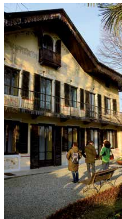
Il Meleto di Agliè

Dalla cappella votiva in vista di Agliè,