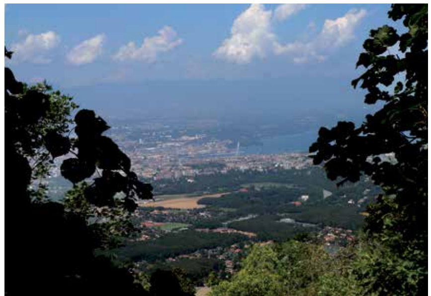
Tra la Savoia e Ginevra nessun ostacolo geografico si frappone al viandante

I frequenti passaggi di Rousseau tra Savoia e Ginevra o Neuchâtel, con gli avventurosi e a volte boccacceschi episodi diurni e notturni, testimoniano bene di un clima per noi bizzarro di coesistenza pratica, se non politica, fra Riforma e Controriforma. Rousseau stesso ondeggiava fra l'una e l'altra, con abiure e controabiure. Molto probabilmente la sua prima adesione al cattolicesimo, subito dopo l'approdo presso Mme de