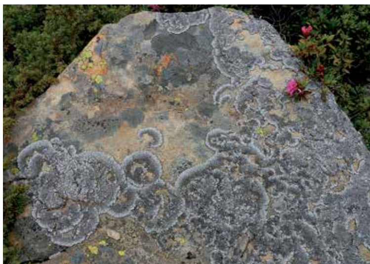
Brodoa intestiniformis a Valnontey (Cogne), poco a monte dei casolari del Money, a circa 2350 m di quota.

Nell'ambito dei servizi di informazione offerti al pubblico presso il Centro visitatori di Covarey e presso l'Espace Champorcher, gli operatori hanno accertato rispettivamente 4.160 ingressi nel corso di 125 giornate di apertura e 2.308 ingressi nel corso di 61 giornate di apertura. L'affluenza a Covarey è comparabile a quella del 2012 e i dati degli ultimi anni sono in linea con quanto registrato nelle tre valli valdostane del Parco Nazionale Gran Paradiso sia per quanto riguarda i giorni annui di apertura, che per i dati medi di frequentazione. I gestori dei punti di accoglienza hanno garantito oltre al servizio informazioni anche la realizzazione e gestione di attività di animazione, educazione e comunicazione.